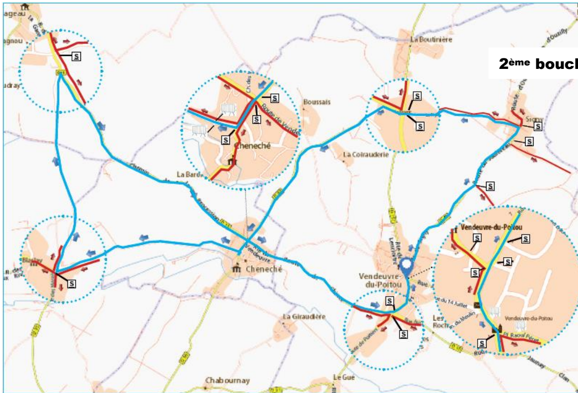
2ème boucle : 20 km