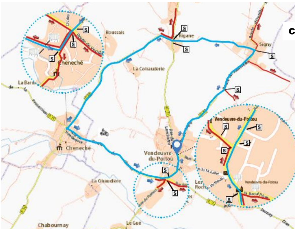
Circuit final : 10 km