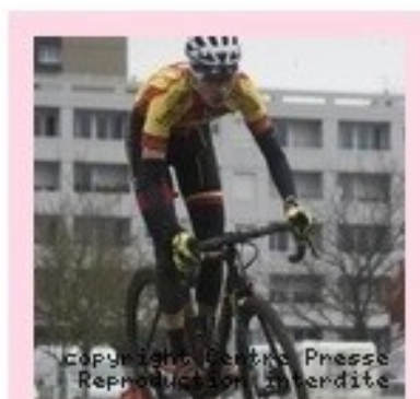
Retour du cyclo-cross de la ville de Poitiers.